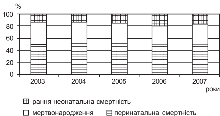
Рис. 2. Структура показника перинатальної смертності в обласному пологовому будинку за 2003–2007 рр.

Вагомий внесок у профілактику материнської та перинатальної смертності в регіоні зробив Центр планово-консультативної та невідкладної акушерсько-гінекологічної допомоги, очолюваний к. мед. н. В. А.