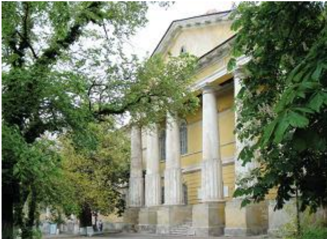
Головний корпус Старої міської лікарні на вул. Херсонській (зараз –вул. Пастера)