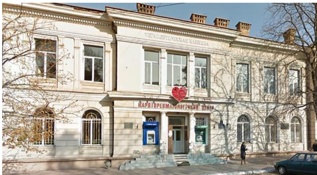
Терапевтическая клиника Медицинского факультета Новороссийского университета (Пастера, 9). Арх. Бернардацци А. И.

По поводу открытия Первого клинического корпуса пропедевтической (диагностической) клиники ректор проф. Ф. Н. Шведов сообщал: «имею честь уведомить господ членов строительной комиссии при Новороссийском университете, что в пятницу, 14 сего февраля в 1 час дня состоится освещение помещения для диагностической клиники» [13].