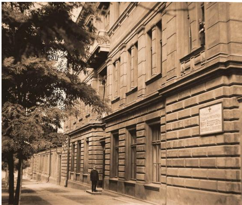
Здание Центральной амбулатории при клиниках медицинского факультета Императорского Новороссийского университета. Арх. Толвинский Н. К., Бернардацци А. И.

Здание является памятником № 567/1 архитектуры и градостроительства местного значения под названием "Главный корпус теоретических кафедр и лабораторий", и входит в состав комплекса из четырёх зданий "Ансамбль Медицинского факультета Новороссийского университета".