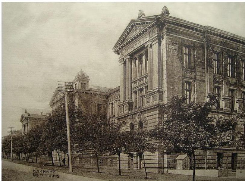
Медицинские лаборатории Медицинского факультета Новороссийского университета. Арх. Толвинский

Самым большим корпусом из воздвигнутых, было здание медицинских лабораторий (1898-1903г), ныне главного учебного корпуса по адресу ул. Ольгиевская, 4. Первый камень застройки был заложен 2 сентября 1898 г. [2]. К 1903 г. в 4-х этажном корпусе было помещено шесть кафедр.