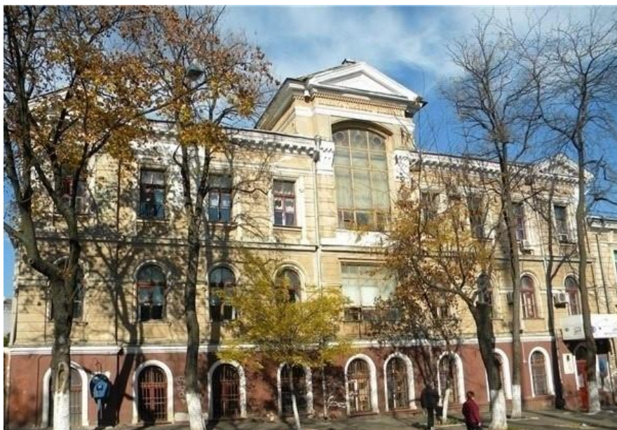
Клиника глазных болезней Медицинского факультета Новороссийского университета. Арх. Бернардацци А. И.

В 1846 г. - склад (магазин) архитектора коллежского ассессора Ф. К. Боффо. В 1883 году участок имел адрес Безымянная пл., 4 / Ольгиевская ул., 4.