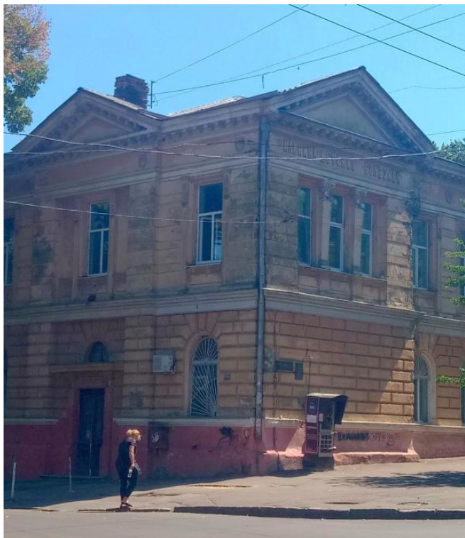
Детская клиника им. Л. А. Абамелик и клиника нервных болезней Медицинского факультета Новороссийского университета.