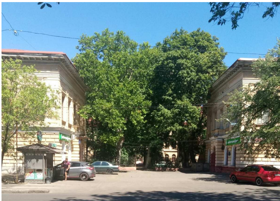
Клиника хирургии, акушерства и женских болезней Медицинского факультета Новороссийского университета. Арх. Толвинский Н. К., Бернардацци А. И.

29 февраля 1904 г. был освящен Второй корпус акушерско-гинекологической и факультетской хирургических клиник по ул. Пастера, 7 [13].