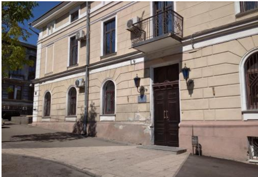
Здание ректората Одесского национального медицинского университета

С 1 января 1901 года при содействии министра финансов С. Ю. Витте в собственность университета перешло здание бывшего хлебного магазина братьев Эфрусси, на тот момент, занятый под казармы для проходящих через Одессу войск [15].